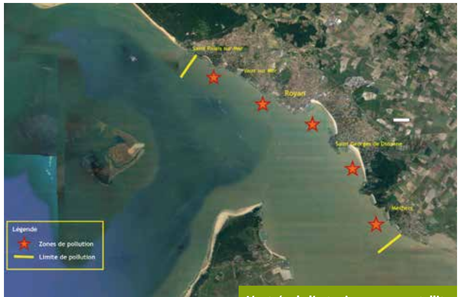
L'entrée de l'estuaire vue par satellite.

Tout au long des deux dernières saisons, certaines plages ont été fermées à la baignade par les maires, soit sur lecture des analyses, soit par précaution après de fortes précipitations, jusqu'à confirmation de l'absence de pollution aux germes fécaux ; les plus touchées Saint-Palais-Bureau, Royan-Pontailiac et Foncillon, Meschers-Vergnes. Les autres plages du Pays Royannais s'en sortent un peu