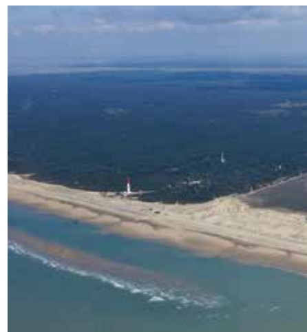
survol de La Coubre

Estuaire pour Tous a été présent sur tous les fronts pendant six ans. Cette victoire, comme celle contre le méthanier dix ans plus tôt, n'est pas tombée du ciel. Notre association a bataillé grâce à vos soutiens dont le nombre est une force face à des adversaires redoutables.