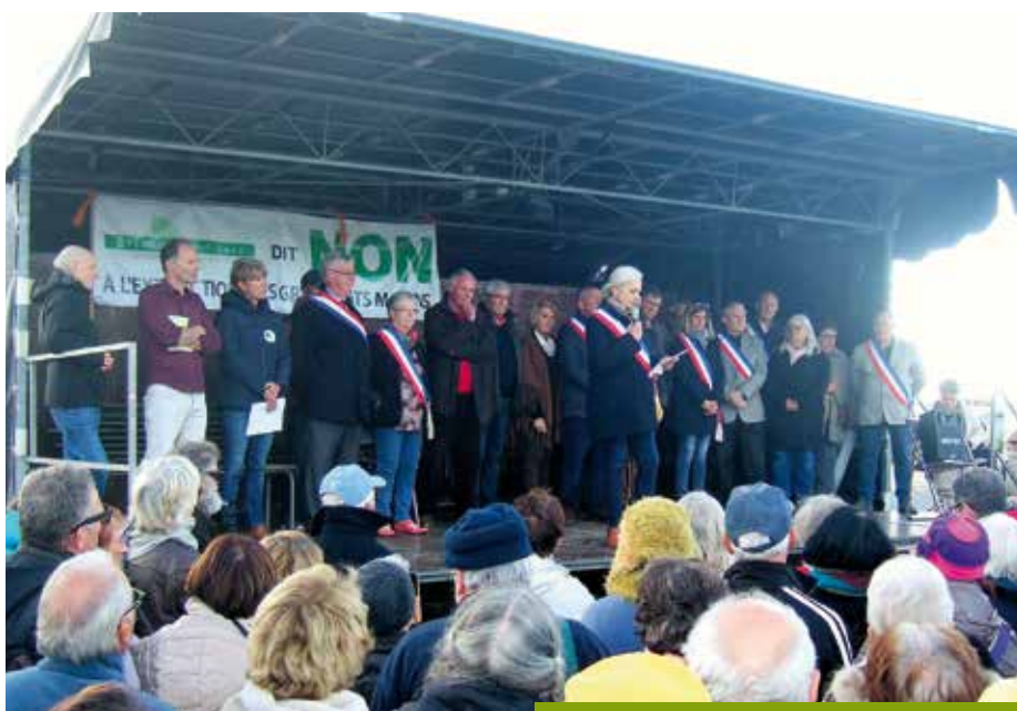
Rassemblement du 27 octobre 2018 à La Palmyre

(extraction massive de sable à quelques encablures de la pointe de bonne anse)